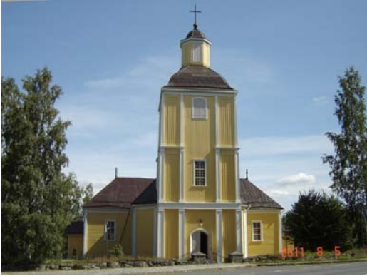
Kuva 2. Hausjärven puinen kirkko, jonka Mårten Tolpo rakensi vuosina 1787–1789. Se on pitkäkirkko, jonka runkokuoneen nurkat on viistetty ja jonka kummallakin sivulla on kapeampi ja matalampi ristivarsi. Pääoven puoleisessa päässä on korkea torni, jossa on kupukatto ja sen päällä ns. lyhty ja risti. Valok. Arno Forsius elokuussa 2011.