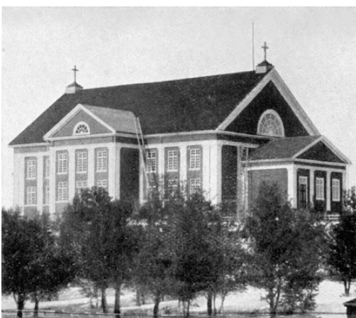
Kuva 20. Nurmeksen puukirkko, jonka Theodor Tolpo rakensi vuosina 1854–1856 isänsä Magnus Tolpon laatiman suunnitelman mukaan. Se on torniton, temppeliä muistuttava pitkäkirkko, jossa on kummallakin sivulla lyhyet sakarat. Rakenteilla olleessa kellotornissa syttynyt tulipalo tuhosi sekä tornin että kirkkorakennuksen vuonna 1891. Nurmekseen rakennettiin uusi tiilikirkko vuosina 1893–1897.