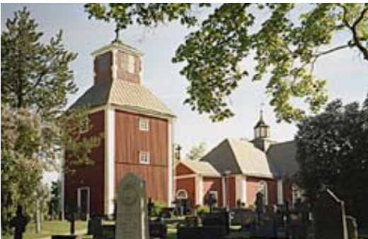
Kuva 4. Karkkilan seurakunnan kirkko. Se oli Vihdin seurakunnan Pyhäjärven Ul. kappeliseurakunnan kirkko vuoteen 1861 ja Pyhäjärven Ul. seurakunnan kirkko vuoteen 1968. Puisen ristikirkon oli piirtänyt Mårten Tolpo vuonna 1774 ja se valmistui laihialaisen kirkonrakentajan Matti Öistin toteuttamana vuonna 1781. Kellotapulin on rakentanut Mårten Tolpo vuonna 1804 ja hän on myös laatinut sen piirustukset. Vuosien varrella kirkon ikkunoita on suurennettu, rakennusten paanukatto on muutettu peltikatoksi ja seinien väri on ollut välillä keltainen. Valok. Arno Forsius 2004.