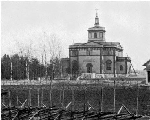
Kuva 13. Rautalammin puukirkko, jonka isä ja poika Magnus ja Theodor Tolpo rakensivat yhdessä vuosina 1842–1844. Kirkko on Carl Ludwig Engelin suunnittelema, uusklassista tyyliä oleva lyhytvartinen ristikirkko. Sen vieressä oli jo vuonna 1736 aikaisempia kirkkoja varten rakennettu kellotapuli.

Kerimäellä kesken kirkon rakennustyön. Hänen puolisonsa kuoli vuonna 1855 asuessaan poikansa Theodorin luona Liperissä.